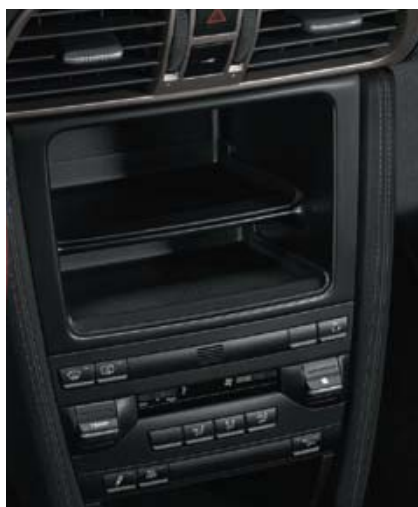
Suppression de la climatisation, suppression du système audio