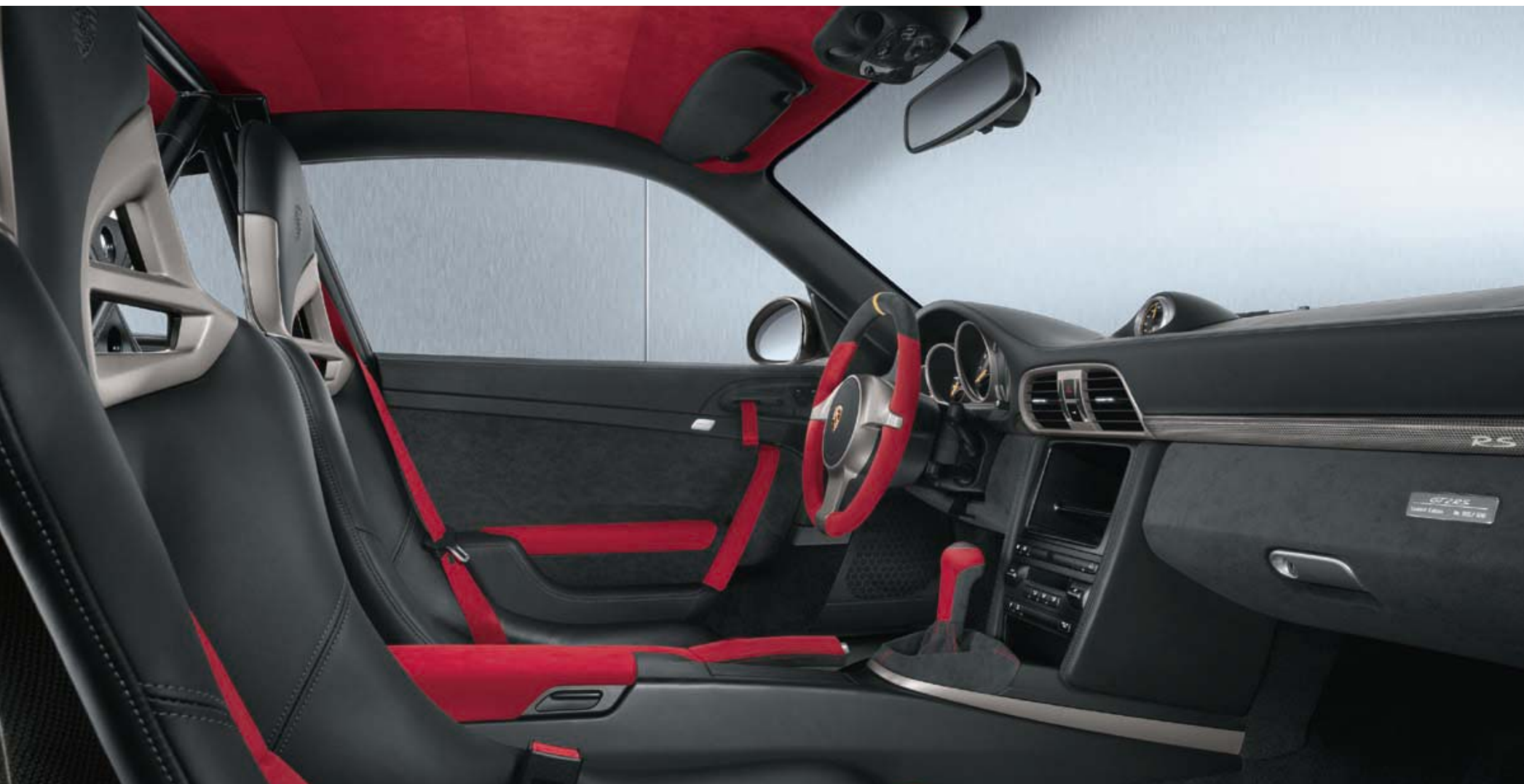
Intérieur tout cuir/alcantara noir/rouge et autres options de personnalisation, dont la suppression de la climatisation, la suppression du système audio, le Pack Chrono