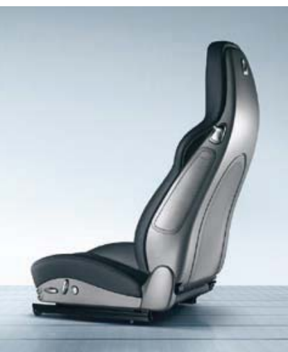
Siège sport adaptatif