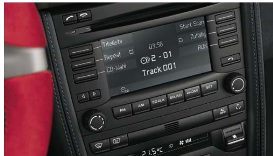
Système audio CDR-30

○ Option disponible • Série G Option gratuite Vous trouverez toutes les informations complémentaires sur les différents équipements personnalisés et les packs d'équipement dans nos tarifs spécifiques.