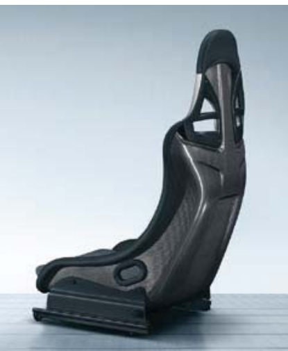
Siège baquet allégé