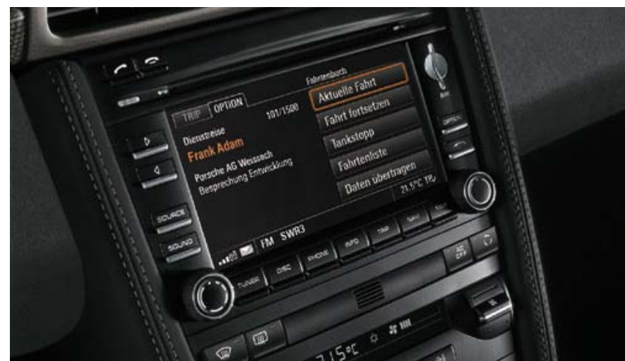
PCM (Porsche Communication Management)