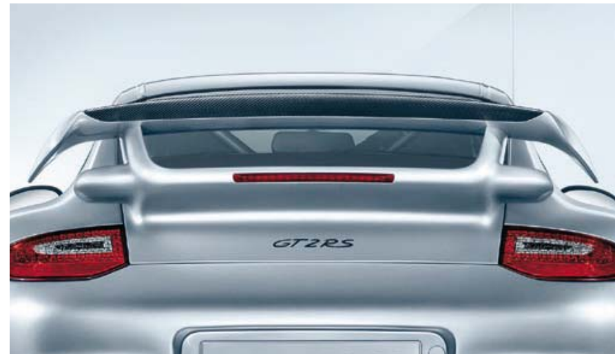
Partie centrale du capot arrière et lèvres de spoiler en carbone