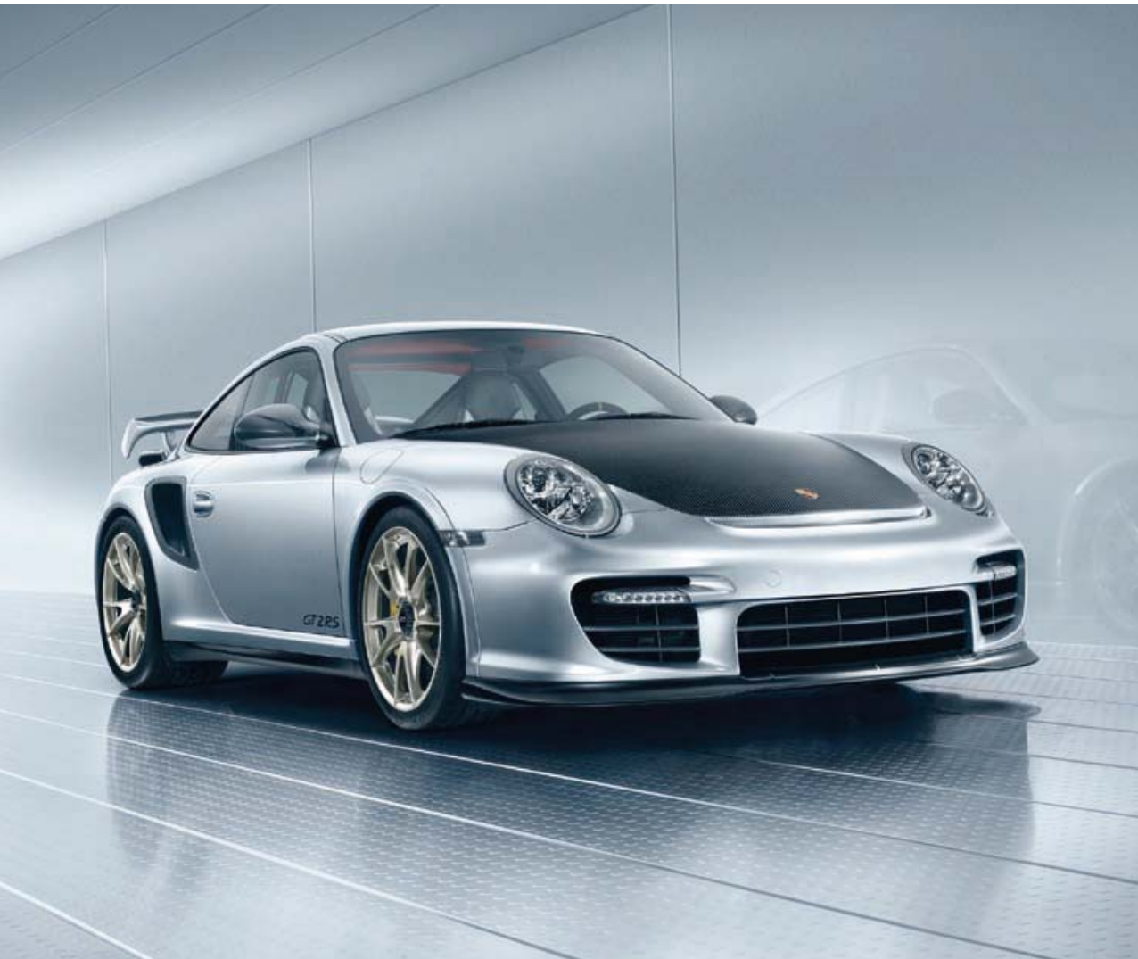
Capot avant et prises d'air latérales des échangeurs d'air en carbone