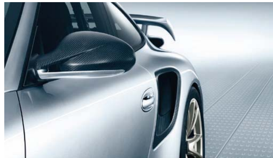
Rétroviseurs extérieurs en finition carbone