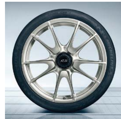
Jante « GT2 RS » 19 pouces

Les 911 GT2 RS sont équipées, au départ de l'usine, de pneus sport 1)