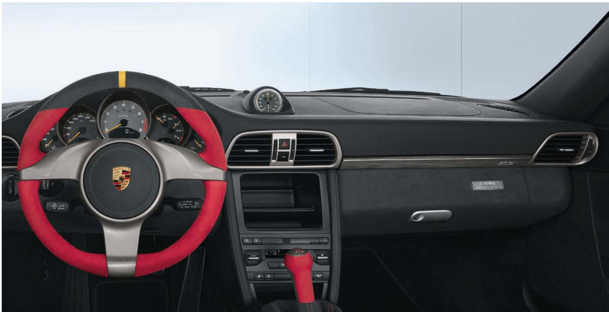
Intérieur tout cuir/alcantara noir/rouge et autres options de personnalisation, dont la suppression de la climatisation, la suppression du système audio, le Pack Chrono