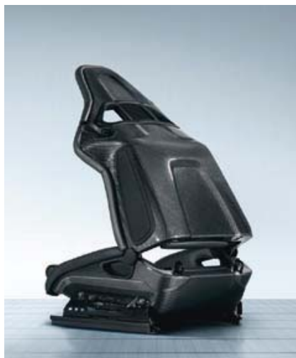
Siège baquet sport